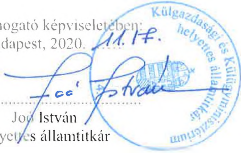
Jón István helyettes államtitkár

A Támogató képviseletében: Budapest, 2020. 11. 17.