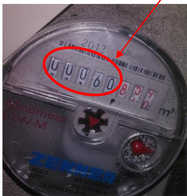
Itt 60 m 3 a mérőállás